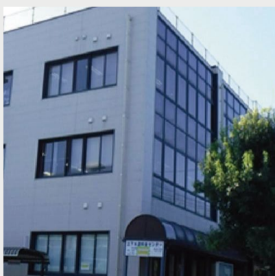
Low-E複層ガラス(真空層)

通常の単層ガラスと比較して、約3倍、熱や冷気を通しにくいガラス。建物の断熱性能が大幅に向上。既存窓枠の流用により、通常業務を行いながら改修が可能。