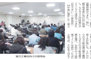
協力工事進捗についての説明会 この説明会では、協力工事の進捗状況や今後の予定について詳しく説明しました。参加者からは、工事の進捗が順調に進んでいることへの安心の声が聞かれました。