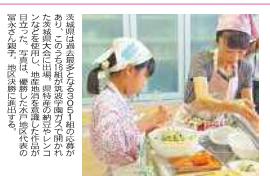
茨城県大会は、茨城県内の各会場から参加者が集まりました。優勝者は、茨城県の親子です。