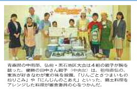
青森県の弘前、黒石地区大会は、4組の親子が参加しました。優勝は、黒石地区の親子です。