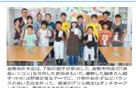
倉敷地区大会は、7組の親子が参加しました。倉敷地区の親子が優勝しました。