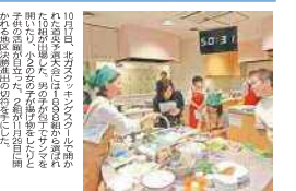
道央予選大会は、道央圏の各会場から参加者が集まりました。優勝者は、道央圏の親子です。