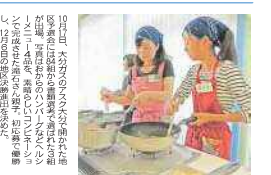
大分地区実技予選会は、大分県内の各会場から参加者が集まりました。優勝者は、大分県の親子です。