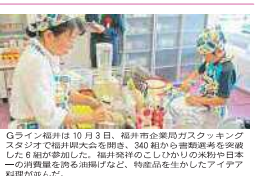
福井県大会は、福井県内の各会場から参加者が集まりました。優勝者は、福井県の親子です。