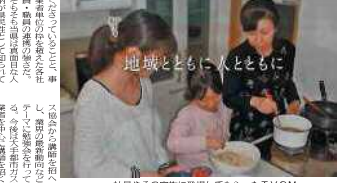
地域とともに人とともに 社員やその家族に登場してもらったTVCM