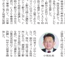
伊賀上野ケーブルテレビ 地域密着のビジネスモデル

伊賀上野ケーブルテレビは、地域密着のビジネスモデルで、行政とともに地域の発展に貢献する。