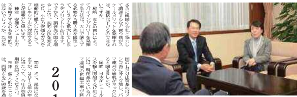
天然ガスの可能性、都市ガス業界への期待と、話題は広がった